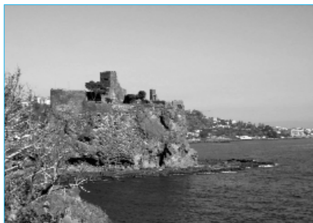
Castello di Acicastello