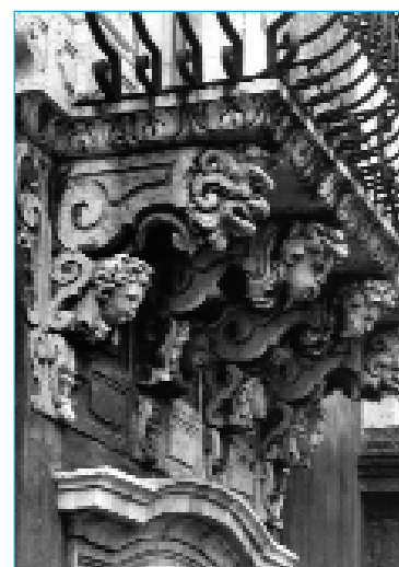
Particolare di un balcone del Monastero dei Benedettini

La passeggiata è finita: l'Etna, maestosa e intrigante presenza, sembra abbracciare dolcemente le chiese ed i palazzi di una città ostinatamente vitale, avvolta dal blu intenso del suo mare e dai colori della nostalgia, bianco e grigio.