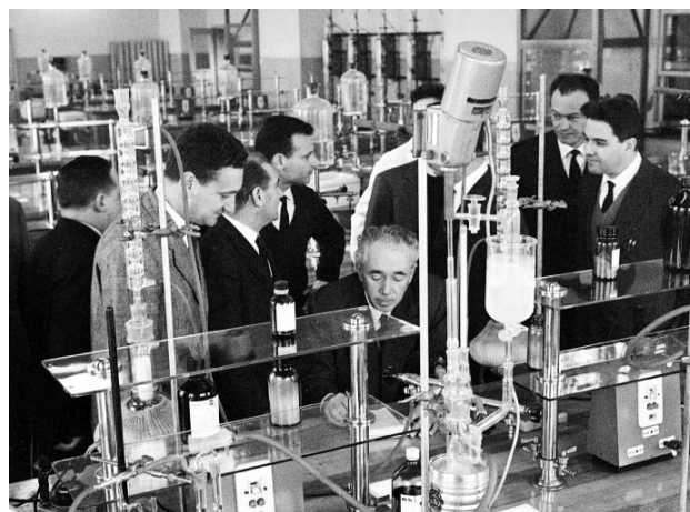
Figura 9: Natta ed alcuni suoi collaboratori in un laboratorio del Politecnico (ottobre 1963). Da sinistra: Gino Dall'Asta (di spalle), Piero Pino, Italo Pasquon, Lido Porri, Giulio Natta, Raffaele Ercoli, Enrico Mantica.

ottenuti a Milano. Furono sintetizzati alcune decine di omopolimeri stereoregolari da olefine, diolefine, cicloolefine a piccolo anello (ciclobutene e norbornene) e inoltre copolimeri alternati stereoregolari (da etilene e butene-2-cis, da etilene e ciclopentene, da etilene e butadiene). Furono sintetizzati anche copolimeri etilene/propilene a carattere elastomerico. Polimeri stereoregolari furono ottenuti anche da monomeri non idrocarburici come alcuni vinilalchilieri, metossistirene, N-vinilcarbazolo, benzofurano, usando vari tipi di catalizzatori. Va ricordato che alcune delle strutture sintetizzate non trovano riscontro in Natura, per esempio i polimeri sindiotattici.