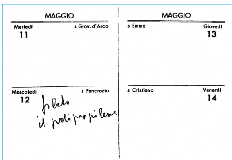
Figura 4: Dall'agenda di Giulio Natta, maggio 1954: "filato il polipropilene".

Natta capì subito l'importanza scientifica e tecnologica dei polimeri cristallini ottenuti. Coniò il termine isotattico per