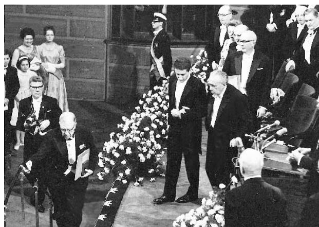
Figura 11: Giulio Natta, al braccio del figlio, va a ricevere il Premio Nobel da Gustav VI Adolf. Dietro il Prof. Natta si vede il prof. Karl Ziegler.

a) l'organizzazione che Natta aveva dato al suo Istituto, dove lavoravano sullo stesso tema chimici, strutturisti, spettroscopisti, tecnologi, il che permetteva un approccio interdisciplinare