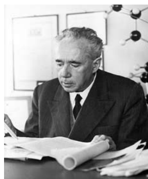
Figura 2: Giulio Natta alla vigilia del premio Nobel nel 1963.

Natta trovò un Istituto relativamente bene organizzato per quei tempi. Passata la guerra, iniziò una collaborazione con la Soc. Montecatini, allora la più grande industria chimica italiana. Nel 1952 istituì, d'accordo con la Montecatini, una Scuola di Perfezionamento in Chimica Alifatica, che veniva frequentata da chimici (in prevalenza) ed ingegneri chimici neoassunti dalla Montecatini (15-20 all'anno). La Scuola consisteva in poche lezioni teoriche e molto lavoro sperimentale. Alla fine del Corso gli allievi venivano inviati a laboratori e impianti Montecatini, ma Natta poteva trattenere più a lungo alcuni allievi se lo desiderava. Con questa Scuola Natta disponeva ogni anno di un corpo di circa 20 giovani ricercatori ed aveva la possibilità di trattenere i migliori per un periodo indeterminato. L'esistenza di questa Scuola ha avuto una influenza difficilmente valutabile sugli sviluppi che si ebbero in seguito, come vedremo. Per quanto riguarda gli interessi scientifici, Natta all'inizio si dedicò prevalentemente a studi strutturistici, seguendo la tradizione esistente nell'Istituto in cui si era laureato. Poi si dedicò a studiare importanti temi dell'industria chimica, come l'estrazione del butadiene dalla frazione C 4 , la sintesi del metanolo, la reazione d'idroformilazione, i catalizzatori in genere come strumento della sintesi industriale.