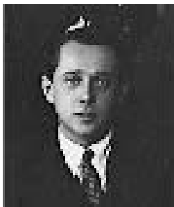
Figura 1: Il giovane ingegnere Giulio Natta nel 1932.